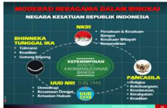
Gambar 1. Moderasi Beragama Dalam Bingkai NKRI. (Abdul Manap, 2022)

sering berbuntut berbagai konflik. Konflik di masyarakat yang bersumber pada kekerasan antar kelompok yang meledak secara sporadis di berbagai tempat di Indonesia menunjukkan betapa rentannya rasa kebersamaan Bangsa Indonesia