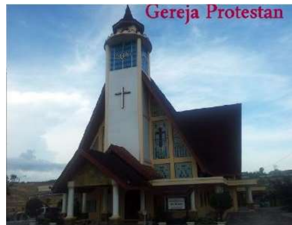
Gambar 6. Tempat Ibadah Kristen Protestan (GPIB Bukit Benuas, 2019)

Jadi jelas bahwa moderasi beragama sangat erat terkait dengan menjaga kebersamaan dengan memiliki sikap 'tenggang rasa', sebuah warisan leluhur yang mengajarkan kita untuk saling memahami satu sama lain yang berbeda dengan kita. Agama Budha di Indonesia sama moderatnya dan sangat mewarisi budaya leluhur. Penulis disini menggambarkan tempat ibadahnya di atas tersebut.