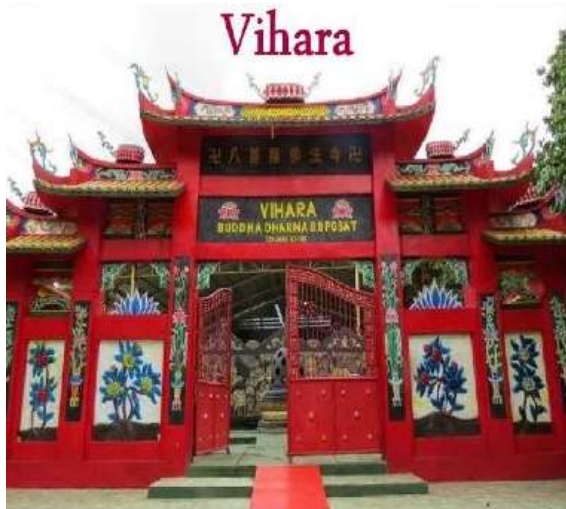
Gambar 4. Tempat Ibadah Umat Budha

Moderat dalam pemikiran Islam adalah mengedepankan sikap toleran dalam perbedaan. Baik beragam dalam mazhab maupun beragam dalam beragama.