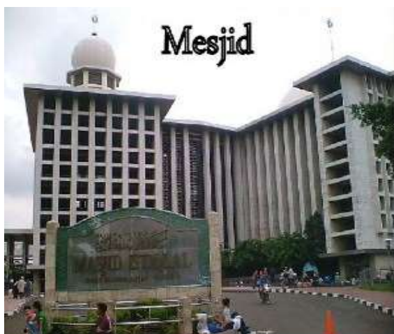
Gambar 2. Tempat Ibadah Umat Islam (Arie Saksono, 2008)

Islam moderat mengedepankan sikap toleransi, saling menghargai, dengan tetap meyakini kebenaran keyakinan masing-masing agama dan mazhab, sehingga semua dapat menerima keputusan dengan kepala dingin (Darlis, 2017).