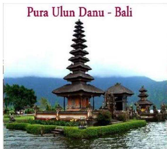
Gambar 3. Tempat Ibadah Umat Hindu (Depag, 2019)

Dalam konteks beragama, untuk memahami teks agama saat ini jangan sampai terpolarisasi pemeluk agama dalam dua kutub ekstrem.