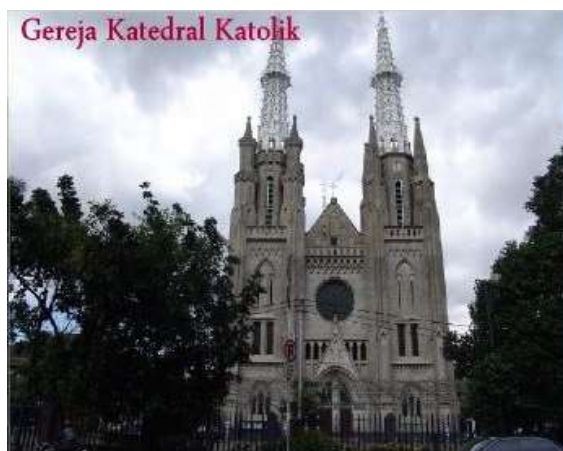
Gambar 5. Tempat Ibadah Umat Katolik (Rendy Nugroho, 2014)

Untuk mewujudkan moderasi tentu harus dihindari sikap inklusif. Menurut Shihab bahwa konsep Islam inklusif, Hindu, Khatolik, Protestan, Budha dan Konghuchu adalah tidak hanya sebatas pengakuan akan kemajemukan masyarakat, tapi juga harus diaktualisasikan dalam bentuk keterlibatan aktif terhadap kenyataan tersebut. Sikap inklusivisme yang dipahami dalam pemikiran adalah memberikan ruang bagi keragaman pemikiran, pemahaman dan perpepsi tentang ajarannya.