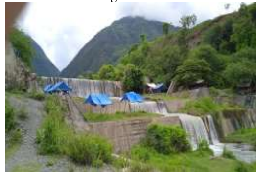
Gambar 5.1: Objek wisata Bendung Misterius

Bendung misterius terletak di Desa Balane Dusun I, awal pembuatan bendung ini pada tahun 1984-1985. Pembangunan bendung dilakukan oleh Dinas Pekerjaan Umum Provinsi dengan maksud untuk memberikan pengairan pada transmigran yang akan menempati Desa Balane dan juga untuk irigasi pertanian, karena sebagian besar mata pencaharian masyarakat di wilayah transmigrasi ini adalah bercocok tanam seperti bersawah atau berladang. Selain itu, bangunan ini juga digunakan untuk menahan laju air Sungai Lewara dari hulu ke hilir. Sebelum dibuat bendung, sungai ini mengalir sangat deras dan tidak terarah dan menyebar yang mengakibatkan tepian sungai semakin melebar, saat terjadi hujan lebat di Desa Balane dan sekitarnya. Bendung ini dibangun disepanjang Sungai Balane dan memiliki enam susun/tingkatan.